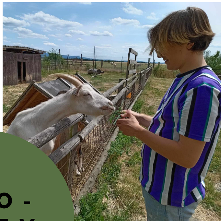
FOTO - AKCE V KLUBU